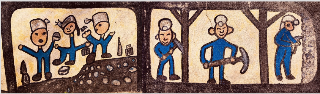
Fresque réalisée par les élèves de l'école Montjoie, à Youx